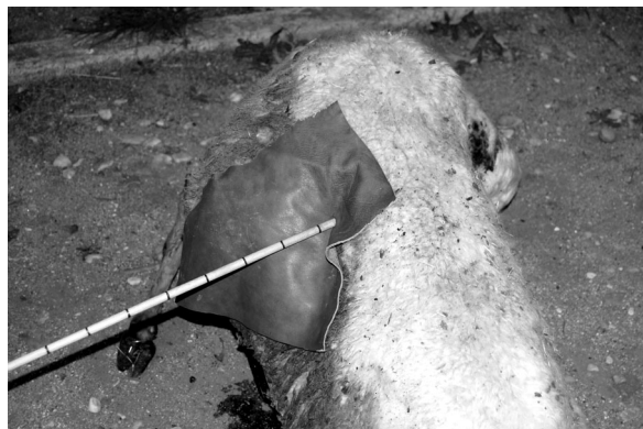
Fig. 4.A y B: Detalle de flecha 7 clavada en la oveja con y sin peto.

Casos excepcionales de resistencia suponen las puntas 10 de arco junto con la 17 y 18 de jabalina, únicamente forjadas. Todas ellas se clavaron en el tronco de madera que sostenía a la oveja, llegando a incrustarse la mitad de la hoja (Fig. 5A). En los tres ejemplares, las puntas fueron extraídas de la madera sin apenas daños y se continuó disparando con ellas. Por el contrario, cuando la punta 1, forjada y recocida, clavada en la madera tras el primer lanzamiento, quedó doblada por la mitad y fuera del empuñadura.