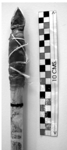
Fig. 3.B. Detalle de la punta de flecha 1, enmangada con tripas de cordero.