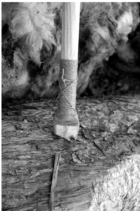
Fig. 5.A. Jabalina 17 clavada en madera.

Las lanzas, utilizadas a modo de pica, sufrieron distintos efectos. La oveja ya había pasado el rigor mortis al inicio de los experimentos pero empezaba a endurecerse, por lo que no resultó fácil clavarle las palmelas. Sin embargo, cuando las puntas penetraron en el cuerpo su efecto fue devastador ya que rompieron distintos huesos, sobre todo en la zona del costillar (Fig. 5B). Especialmente útil resultó la pieza 24 con la que se impactó en el animal hasta en 23 ocasiones, se falló en dos tiros debido a que se había sobrepuesto a la oveja el peto de cuero de 2 mm.