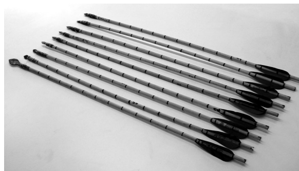
Fig. 2.B. Parte de las puntas de flecha montadas.

Las jabalinas y las lanzas. Fueron montadas sobre vástagos de madera de pino de 163 \times 2 cm las primeras y 200 \times 2,8 cm las segundas. En ambos casos se practicó una abertura en caja en la zona superior para insertar los pedúnculos de las puntas. Éstas fueron fijadas, además, con cuerda de lino. Los pesos medios de jabalinas y lanzas montadas fueron de 346 gr para la jabalina con punta media y 658 gr para la lanza con punta grande (Fig. 2: A, B, C).