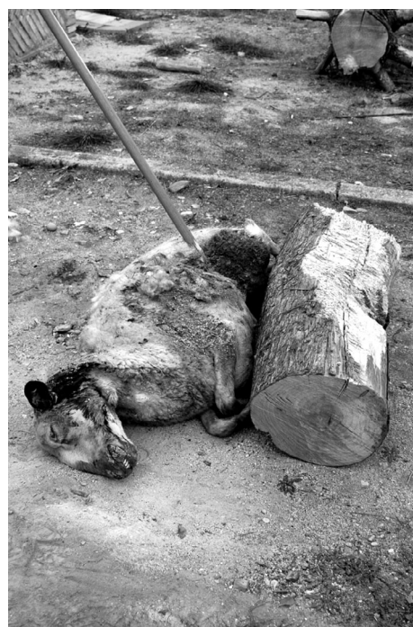
Fig. 5.B. Lanza 24 clavada en la oveja.