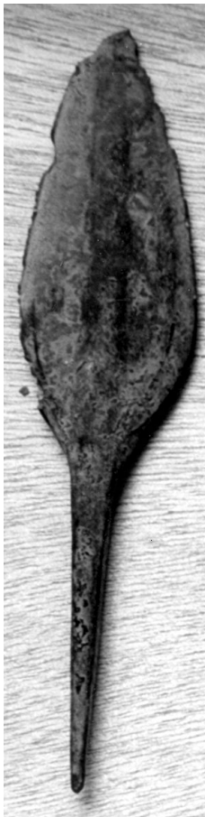
Fig. 1. Punta palmela con grueso nervio central. Coca, inédita.

A pesar de la escasa diversidad morfológica que facilita el reconocimiento de estas puntas, en el registro arqueológico se observa un fuerte abanico de tamaños y pesos, según se desprende de la