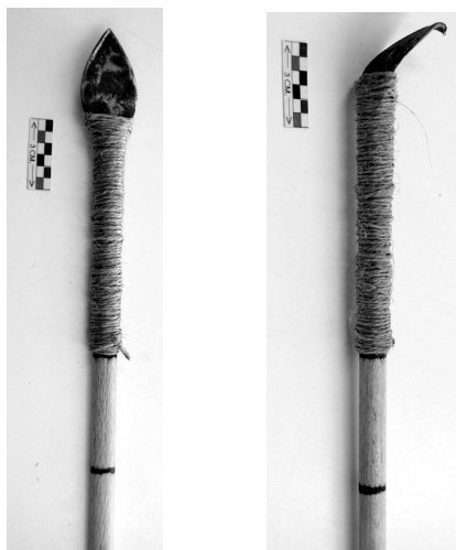
Fig. 3.C y 3.D. Punta de flecha 9 antes y después del uso.