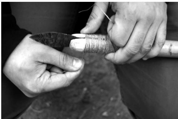
Fig. 3.A. Enmangado de una lanza con cuerda de lino.