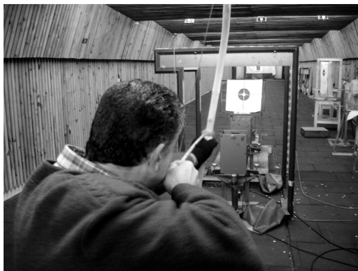
Fig. 6. Tiro con arco. Experimento de balística.

hay muy poca diferencia entre la de cobre y la de bronce.