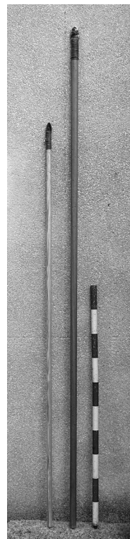
Fig. 2.C. Lanza y jabalina.