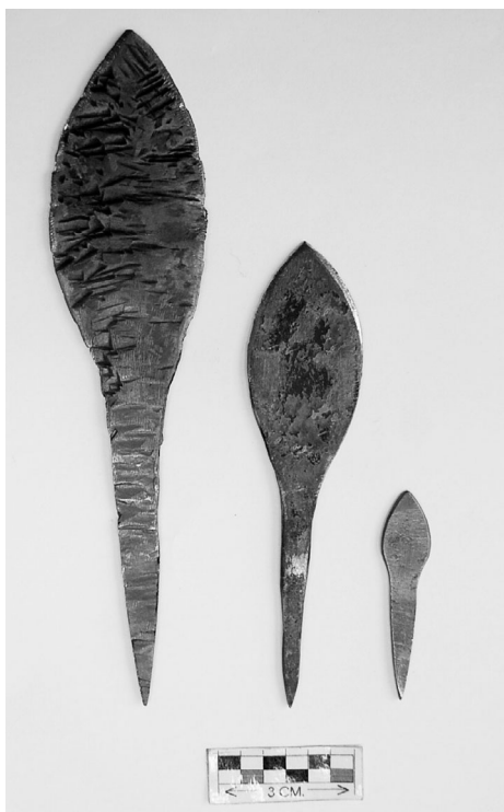
Fig. 2.A. Los tres tamaños de puntas de palmela.