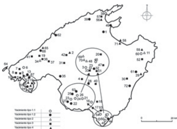
Fig. 6. Rutas de penetración y de recepción y redistribución entre núcleos. Tipología de los yacimientos: Asentamientos con murallas (1.1.) y sin ellas (1.2.); talayots aislados (2); estructuras con funciones indefinidas y yacimientos sin estructuras en superficie (3), Cuevas/ santuarios/ túmulos aislados (4): 1. Ca Na Bàssera, 2. Son Perot-Es Bosquets, 3. Can Verd, 4. Son Veny, 5. Son Fortuny, 6. S'Alqueria, 7. S'Olivar Vell, 8. Camí de Morella, 9. Pla de Son Forners, 10. Sa Vinya des Metge, 11. Son Catiu, 12. Es Fornets, 13. Sa Torrota, 14. Ses Penyes Rotges, 15. Sa Vinya-Son Sastre, 16. Son Perot, 17. Sa Barra-la, 18. S'Alqueria Fosca, 19. Es Bosquet, 20. Son Gil de Dalt, 21. Sa Talaia, 22. Capocorb Vell, 23. Gomera, 24. Can Moger, 25. Cas Frares, 26. Es Pedregar, 27. S'Àguila d'en Quart, 28. Es Figueral, 29. Sa Gruta, 30. Taiet, 31. Es Puig Blanc, 32. Puig des Moros, 33. Galiana, 34. Sarrià, 35. Son Oms Vell, 36. Sa Sínia, 37. Cas Jai, 38. Bóquer, 39. Pedruixella, 40. Sa Figuerassa, 41. Son Balaguer, 42. Can Moragues, 43. Rafal des Porcs-Es Balç, 44. Rafal des Porcs-Es Favassos, 45. Sa Talaia Grossa, 46. Es Meià, 47. Son Baró, 48. Binifat, 49. Pollentia, 50. Sa Vinya, 51. Putxet d'en Font, 52. Es Picó, 53. Rafal Llinàs-Na Mera Petita, 54. Antigors, 55. Puig de sa Morisca, 56. Sa Punta, 57. Gotmar, 58. Illa des Porros, 59. Sa Cova, 60. Ses Païsses, 61. Son Carrió, 62. Puig d'en Canals, 63. Son Taixaquet, 64. Cova des Moro o de sa Font (Dragonera), 65. Son Mas, 66. Son Ferrer, 67. Turó de Ses Beies, 68. Son Ferrandell, 69. Son Fred, 70. Cascanar, 71. Punta des Patró, 72. S'Hospitalet Vell, 73. Son Fornés.

suroeste con respecto al central está en torno a los 35 y 25 km, respectivamente. Esta distancia es perfectamente accesible por animales de tiro guiados por los intermediarios. Una jornada a pie ha sido calculada para contextos prehistóricos en unos 27-32 km (Ruiz-Gálvez 1992: 96).