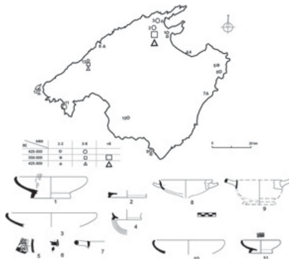
Fig. 3. Cerámica ática de barniz negro de Son Mas, formas Lamboglia 21 (Lamboglia 1952) (1 y 3), Bolsal –Lamboglia 42 Ba– (2), Skyphos –Lamboglia 43– (4), fragmento decorado de figuras rojas (5) y fragmento de asa de cerámica ática de barniz negro (6). Skyphos tipo 744-763 procedente de Puig de sa Morisca (7) y Kylix (8), Bolsal –Lamboglia 42– (9) y Lamboglia 21/forma 2770 de tamaño grande (10) y pequeño (11) del yacimiento de La Punta (Cerdà 2002). Dispersión de la vajilla fina entre el 425-350 y 350-300 a.C. o, indistintamente, entre ca. 400-300 a.C.; tamaño del símbolo de acuerdo al Número Mínimo de Individuos (NMI). Datos obtenidos mediante prospección arqueológica y prospección. 1. Pollentia, 2. Sa Punta, 3. Gotmar, 4. Illa des Porros, 5. Sa Cova, 6. Ses Païsses, 7. Son Carrió, 8. Puig d'en Canals, 9. Na Guardis, 10. Son Taixaquet, 11. Puig de sa Morisca, 12. Cova des Moro o de sa Font (Dragonera), 13. Son Mas.

fina (Fig. 3). Además consideramos dos fragmentos de cerámica de figuras rojas, recuperados en excavaciones en el santuario de Son Mas. Pertenecen a sendas cráteras de campana procedentes