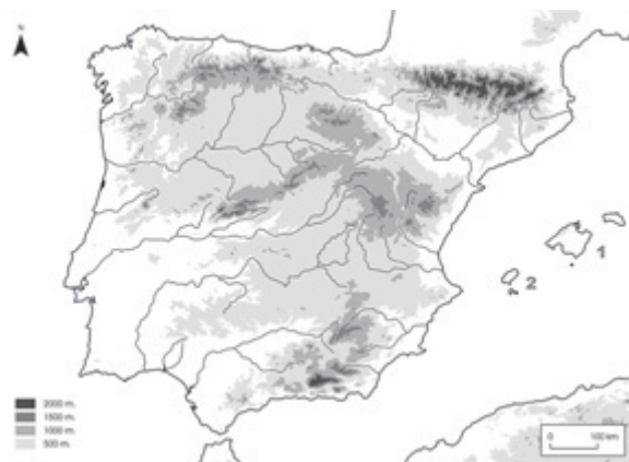
Fig. 1. Mapa de la Península Ibérica y las Islas Baleares. (1) Mallorca, (2) Eivissa.

En el actual estado de la investigación, hay que dar un paso atrás y plantearnos si es posible de-