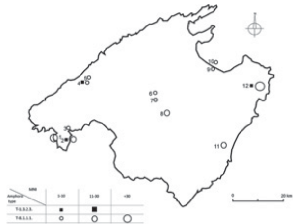
Fig. 5. Dispersión de los tipos anfóricos 1.3.2.3 (450-400 a.C.) y T.8.1.1.1. (400-300 a.C.); tamaño del símbolo de acuerdo al Número Mínimo de Individuos (NMI); datos obtenidos mediante excavación; 1. Puig de Sa Morisca, 2. Son Ferrer, 3. Turó de Ses Beies, 4. Son Ferrandell, 5. Son Mas, 6. Son Fred, 7. Cascanar, 8. Son Fornés, 9. Punta des Patró, 10. Illa des Porros, 11. S'Hospitalet Vell, 12. Ses Païsses.

Estos datos han sido analizados según criterios cualitativos (presencia/ausencia) y cuantitativos (número mínimo de individuos -NMI), utilizando, en su caso, mapas de dispersión ( mapping ). La cronología de las ánforas ebusitanas (tipos 1.3.2.3. y 8.1.1.1.) oscila entre la segunda mitad del siglo V y el siglo IV a.C. (Figs. 2 y 4) y la de las cerámicas de barniz negro, entre la primera y la segunda mitad del siglo IV a.C. (Fig. 3). Los resultados se han contrastado con la dispersión del ánfora ebusitana del siglo III a.C. (tipos 8.1.2.1. y 8.1.3.1.) (Fig. 5).