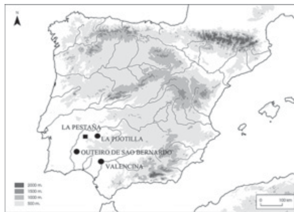
Fig. 2. A: Fotografía de objetos cerámicos, óseos y metálicos procedentes de la Dehesa de la Pestaña (Badajoz), perteneciente al archivo de Aurelio Cabrera Gallardo. B: Piezas metálicas de la fotografía tras su tratamiento para eliminar sombras. Las n.º 5 y 6 corresponden a las puntas de jabalina de tipo La Pastora, no localizadas.

La Dehesa de la Pestaña o los Fresnos, como indistintamente la denominó Luis Villanueva, su antiguo propietario y excavador (Ortiz 2008: 287), tenía diversas estructuras tumulares o “turruñuelos” ya desaparecidas (Molina Lemos 1978, 1979). Según su propio testimonio (Villanueva 1894), al menos una fue objeto de desmontes e intervenciones a fines del siglo XIX. Según el estudio crítico de las mismas debido a P. Ortiz Romero (2008: 288-292) la finalidad de